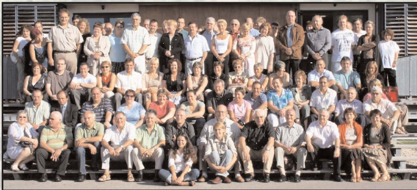
Participants du CAMA 2007