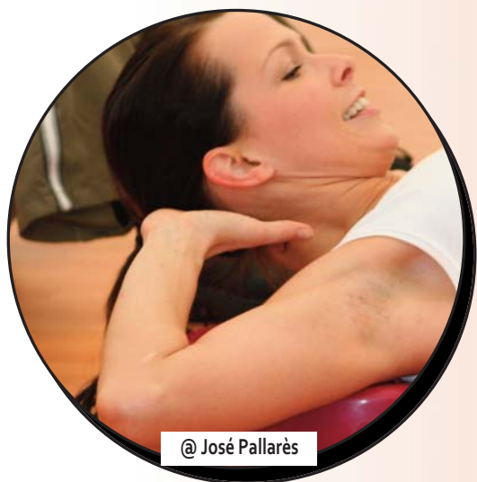
@ José Pallarès

PUBLICS : enfants, adolescents, adultes et seniors